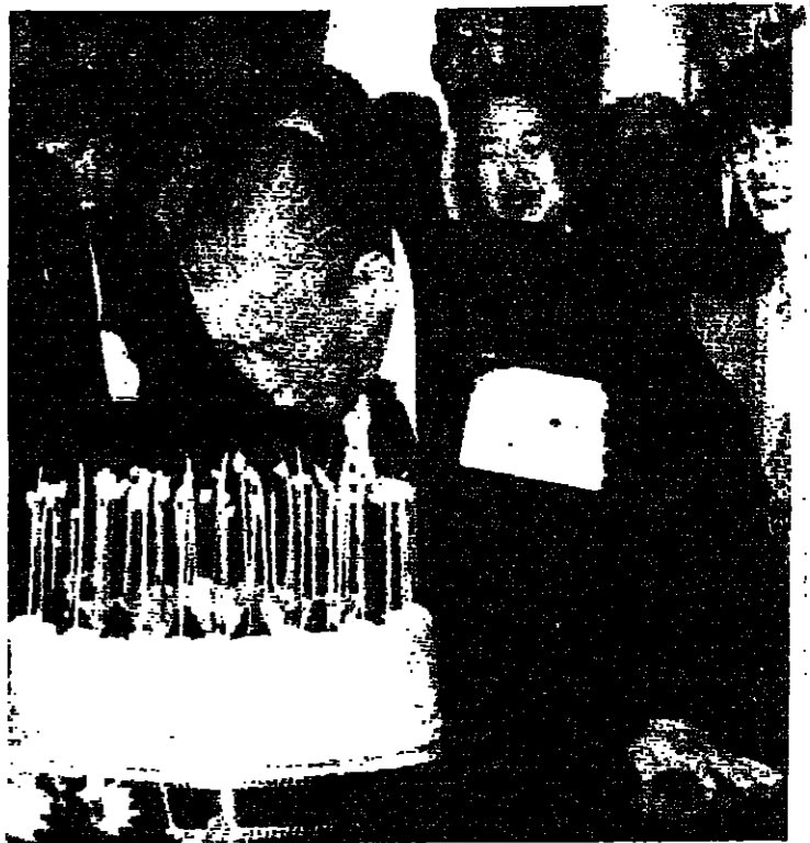
نوبور تاكيشيتا، رئيس وزراء اليابان، يطفئ الشموع المغرسة في قلب الحلاوى الذي قدمه له الموظفون في مكتبه في ٢٦ الجاري بمناسبة عيد ميلاده الخامس والسبعين.